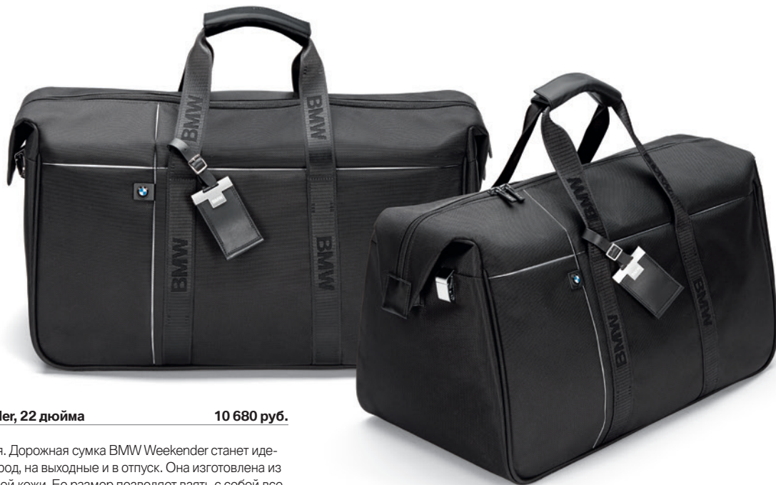
Дорожная сумка BMW Weekender, 22 дюйма